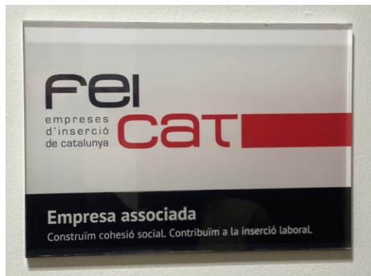
Placa de metacrilat per a les empreses sòcies de FEICAT.

D'aquesta manera, celebrem que cada vegada més entitats aposten pel camí de la inserció laboral i veuen necessari identificar-se amb la nostra federació. Continuem creixent i seguim treballant per representar i defensar els drets i interessos de les empreses d'inserció i és gràcies a elles que cada cop tenim més incidència i repercussió positiva en la societat.