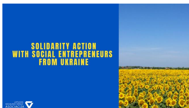
Cartell de l'acció liderada per un dels membres d'ENSIE

En un context de guerra i crisi humanitària com la que s'està vivint a Ucraïna, el sector de l'economia social ha demostrat la seua capacitat d'ajuda i actuació. Un exemple d'això són les empreses d'inserció europees membres d'ENSIE, les quals han actuat tant per a ajudar els refugiats ucraïnesos a establir-se a Europa com per a prestar ajuda directa als que es queden a Ucraïna.