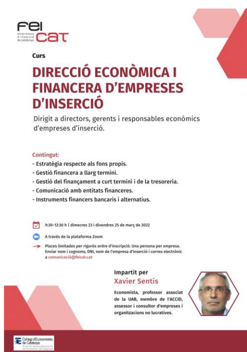
Cartell informatiu de la formació.

Arrel de l'èxit de la formació per a directius d'empreses d'inserció que es va organitzar al 2021, es van recollir una sèrie de propostes que des de FEICAT s'aniran implementant. La més repetida fou el mantenir el ritme anual de trobades de caire formatiu per a directius d'empreses d'inserció.