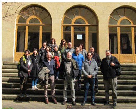
La Junta Directiva de FEICAT i representants d'empreses d'inserció al Seminari de Vic.

La Junta Directiva de FEICAT va celebrar el passat 22 de març una reunió interna ordinària i una posterior trobada amb les empreses d'inserció d'Osona i les comarques de Girona al Seminari de Vic.