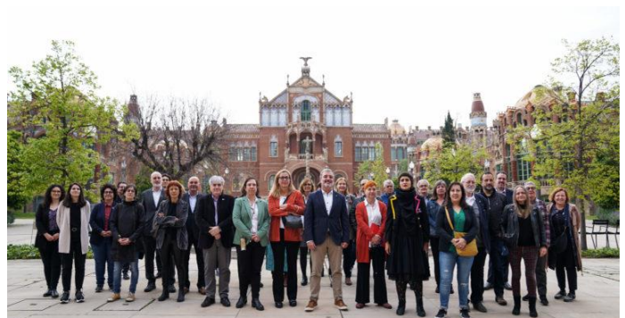
Els representants de l'Acord a l'Hospital Sant Pau, el 19 d'abril de 2022.

L'acord té com a objectiu millorar l'accés a l'ocupació a la ciutat i l'accés a la feina de les persones en situació d'atur, mitjançant el disseny de la concertació entre les administracions i els agents implicats en les polítiques actives a la ciutat.