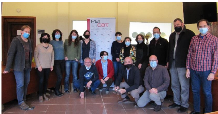
Participants de la trobada d'empreses d'inserció de les comarques de Girona.

FEICAT va escollir la localitat de Vic per a l'ocasió donat que les comarques del voltant són les que han presentat major creixement respecte a la creació d'empreses d'inserció en els últims anys. Durant aquest any es celebraran més trobades amb altres empreses d'inserció en diferents punts de Catalunya.