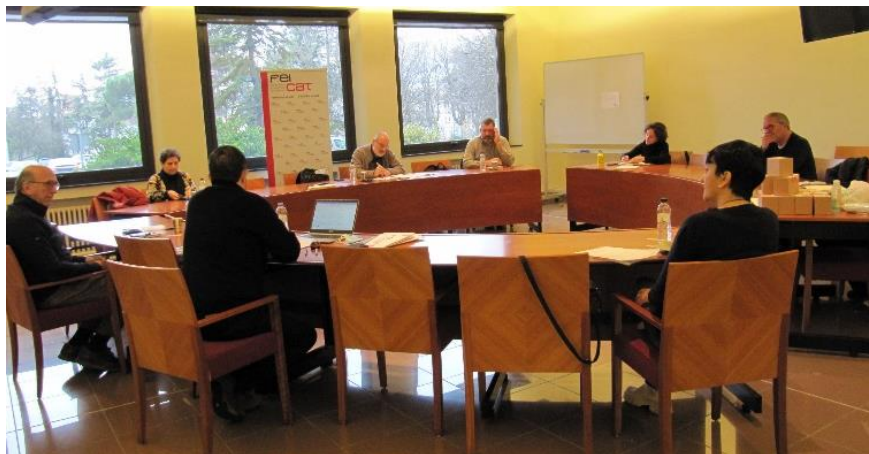
Reunió de la Junta Directiva de FEICAT el 22 de març al Seminari de Vic.