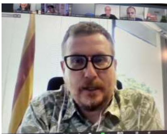
Intervenció del director general d'economia social, Sr. Josep Vidal, en l'Assemblea de FEICAT

Respecte a les votacions celebrades a l'Assemblea, ressaltem que la memòria de gestió 2020, el tancament econòmic, així com el pla d'acció i el pressupost del 2021 es varen aprovar sense cap vot en contra.