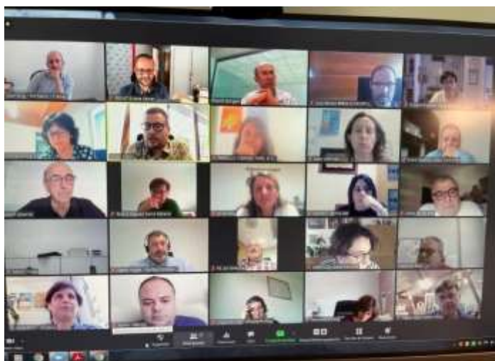
Imatge parcial de l'Assemblea de FEICAT