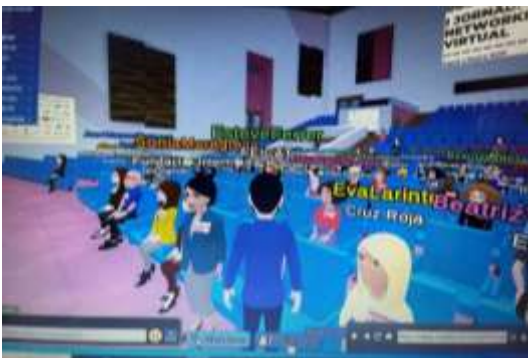
Imatge de la sala d'actes uns minuts abans de començar l'acte.

Cada participant havia de crear el seu propi "avatar" per tal de participar a l'acte o als processos de selecció de personal.