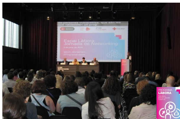
Sala Moragues del Born durant l'acte institucional

El Programa Làbora, és un projecte de ciutat, innovador i a favor de la inclusió social, liderat per l'Institut Municipal de Serveis Socials de l'Ajuntament de Barcelona, amb la col·laboració de les entitats socials, representades per ECAS (Entitats Catalanes d'Acció Social), FEICAT (Empreses d'Inserció de Catalunya) i Creu Roja, i del teixit empresarial de la ciutat.