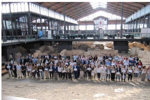
Diploma de reconeixement a les empreses col·laboradores del Programa Làbora

Posteriorment es va procedir al lliurament del Segell Làbora a les empreses i entitats col·laboradores, com a reconeixement a la seva participació i compromís.