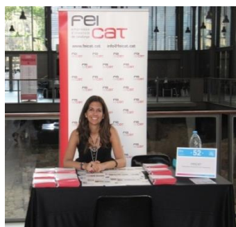
Stand de FEICAT a l'Espai Làbora

En l'Espai de Networking, desenes d'empreses van entrevistar a persones candidates participants del Programa, per tal que puguin optar a cobrir llocs de treball o formar part de les seves borses de treball. Paral·lelament, la Jornada va oferir una sèrie de tallers formatius orientats a la millora de l'ocupabilitat dels/les participants a la Jornada.