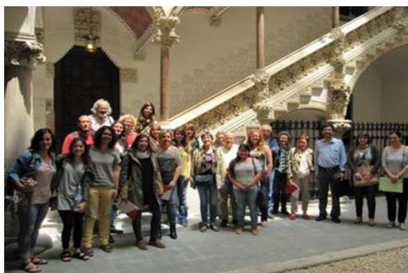
Foto grupal de tècnics i tècniques que van formar part de la jornada al Palau Macaya