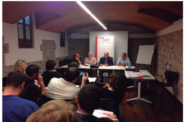
Saló durant el transcurs de l'Assemblea General Ordinària de Socis de FEICAT

La novetat destacable va ser que per primer cop es va fer una auditoria independent dels comptes anuals de Feicat. Aquest exercici de transparència i bona gestió es pretén fer anualment. L'empresa auditora UniauditOliverCamps ha elaborat l'informe corresponent que posa en evidència la transparència i fidelitat de la comptabilitat de FEICAT.