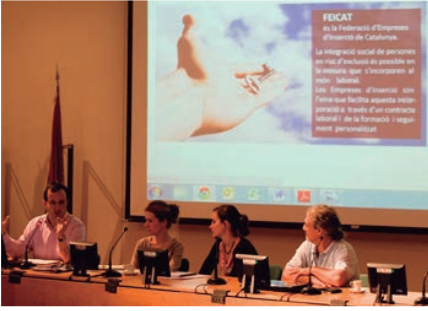
Presentació de l'activitat de FEICAT als representants d'arreu d'Europa del projecte Europe 4all!