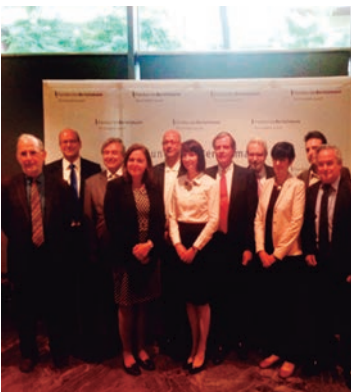
Foto d'alguns dels ponents de la jornada de la Fundació Bertelsmann