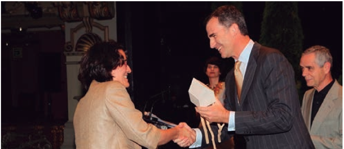
S.A.R. Felip de Borbó entregant el premi a la Sr. Catalina González

El dilluns 19 de maig la Fundació Novia Salcedo va lliurar a Bilbao el premi "petita empresa" a l'empresa d'inserció SAOPRAT, SL per l'enfoc avançat a l'hora de crear oportunitats que facilitin el pont entre la formació a joves vulnerables i la incorporació al món laboral.