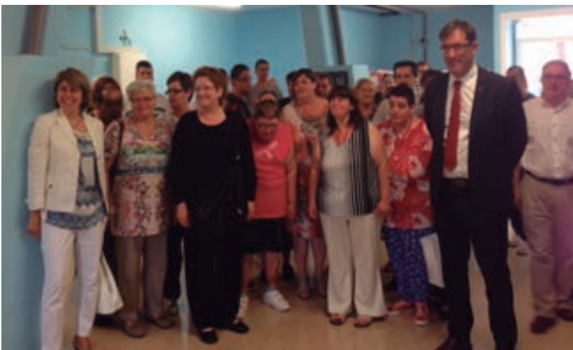
Autoritats i convidats a l'acte

Usuaris, amics i treballadors de l'empresa d'inserció vàrem compartir una estona agradable i vàrem desitjar molta sort a la nova iniciativa de F.T.C. L'acte va acabar amb una descoberta de placa que es va fer sota una original... pluja de bombolles!